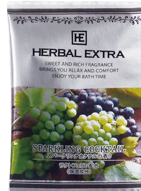
スパークリングカクテル

フルーティな香りで心と体をリラックス。 どの香りも爽やかですっきりしているのが特徴。 保湿成分・引きしめ成分がそれぞれに配合された贅沢な入浴料です。