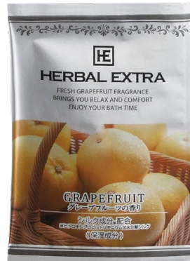
グレープフルーツ