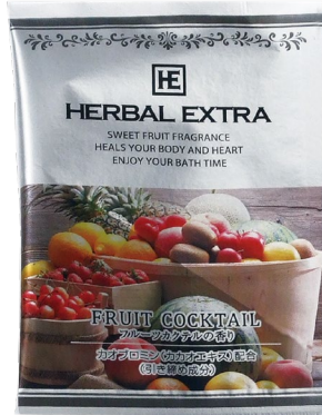
フルーツカクテル