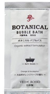
オレンジハーブの香り