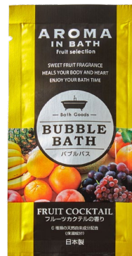
フルーツカクテルの香り