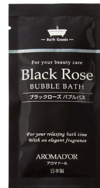
ブラックローズの香り