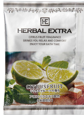
シトラスフルーツ