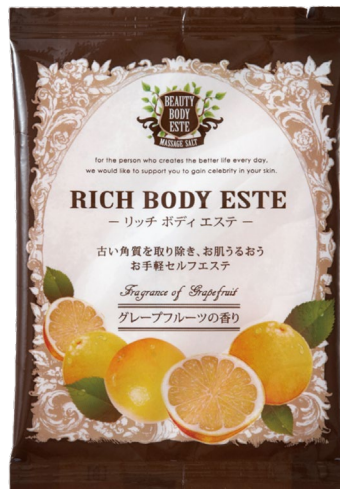
グレープフルーツ