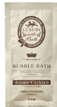
アロマカクテルの香り